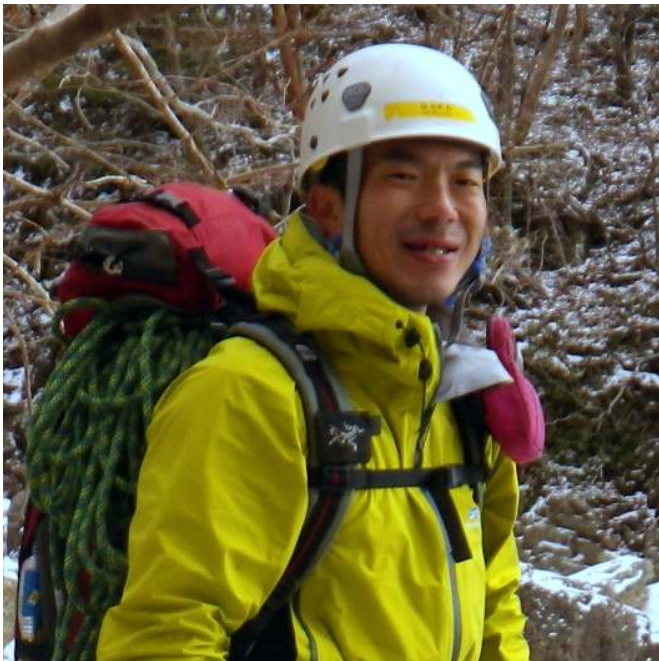
登山の基本となる機能性ウエアの重ね着について、わかりやすく説明します。